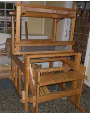
Bild eines Webstuhls der Webstuhl- manufaktur Rudi Künzl

Wir bitten um Ihre Unterstützung beim Ankauf eines Webstuhls und der dazugehörigen Utensilien.