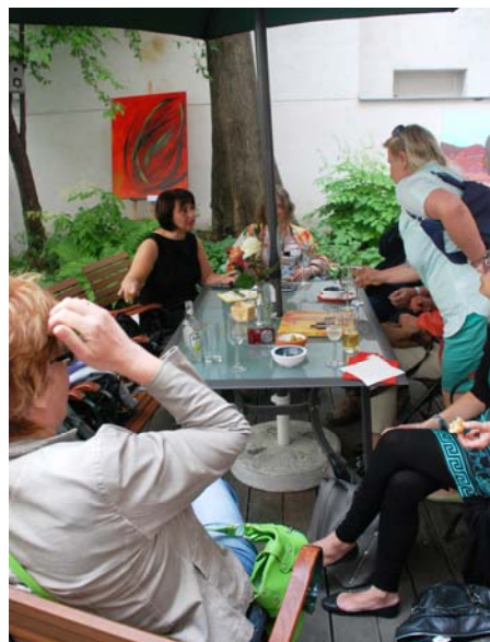
Offenheit und sichtliche Freude an der Begegnung herrschte bei der diesjährigen Hof-Vernissage von Rainman's Home in der Teschnergasse! Mehr Bilder im Fotoalbum von www.rainman.at .

Eine viel beachtete Initiative wurde von Thorkil Sonne, selbst Vater eines "Asperger-Autisten" ins Leben gerufen. "Specialisterne" setzt sich zum Ziel, für hochbegabte autistische Menschen Plätze im ersten Arbeitsmarkt zu finden. In Zusammenarbeit mit Firmen soll das gelingen, fachliche Begleitung ist aber nötig. Auch dieses Projekt kostet Geld, bringt aber vielen etwas. Die Gesellschaft erreicht ein Stück mehr Offenheit, einigen autistischen "Spezialisten" werden Chancen eröffnet und deren besondere Stärken gezielt eingesetzt.