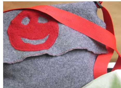
Neben Textildruck sollen bald auch Filzen und Weben unser kreatives Angebot bereichern

Der Ausbau des Snoezelenbereichs muss noch etwas aufgeschoben werden, soll aber noch heuer umgesetzt werden. Außerdem planen wir den Aufbau einer eigenen Textilwerkstatt mit den Schwerpunkten Weben und Filzen .