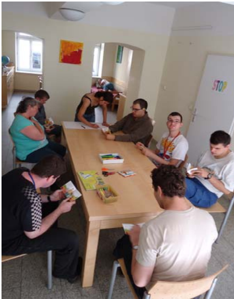
Individuelle Förderung in der Gruppe

So wie bei der Entwicklung gesunder Kinder Anforderungen und Ansprüche altersgemäß sein müssen, ist die Prämisse für unsere Angebote und Förderungen, dass sie dem jeweiligen Entwicklungsstand entsprechen müssen.