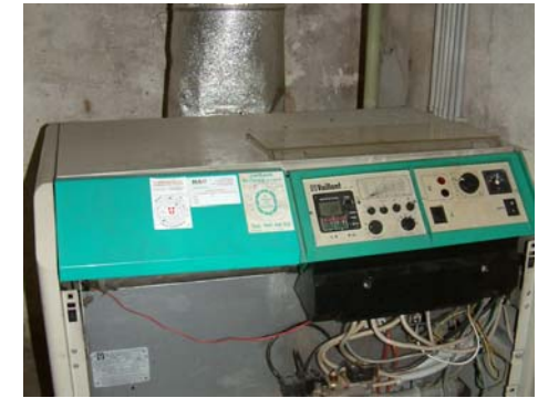
Die alte Heizanlage muss heuer dringend durch ein modernes, energiesparendes Gerät ersetzt werden

Ein großes Problem: Die alte Heizanlage muss dringend erneuert werden. In diesem Winter fiel sie immer wieder aus. In Hinblick auf die gestiegenen Energiepreise ist auch eine Senkung des Energieverbrauchs dringend notwendig.