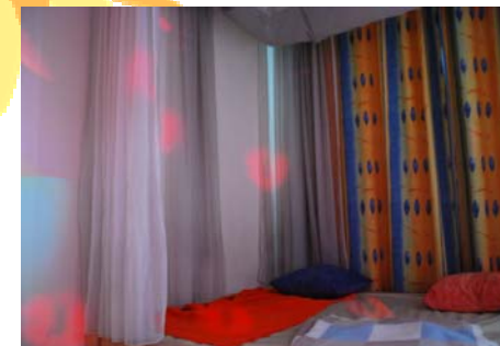
Liegelandschaft in unserem Snoezelenraum

schlummern) – versteht man den Aufenthalt in einem gemütlichen, angenehm warmen Raum, in dem man, liegend oder sitzend, umgeben von leisen Klängen, Lichteffekte betrachten kann. Die beiden Studenten leisteten ihren Zivildienst in einem Altersheim.