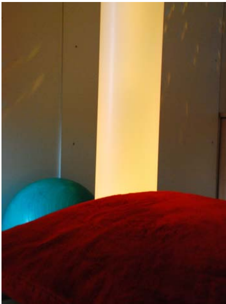
Lichtsäule in veränderbaren Farben

Könnten jetzt noch Düfte und Vogelgezwitscher oder das Plätschern eines Baches sie umfassen, dann ließe sich die beruhigende Wirkung noch steigern.