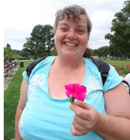
Sommergefühle an düsteren Tagen wecken

Kennen Sie die Wirkung der Lichttherapie in einer Bio-Sauna? Erinnern Sie sich an die wohltuende Stimulanz angenehmer Gerüche, versetzt Sie der Klang von Vogelzwitschern und Wassermurmeln geistig in den grünen Wald?